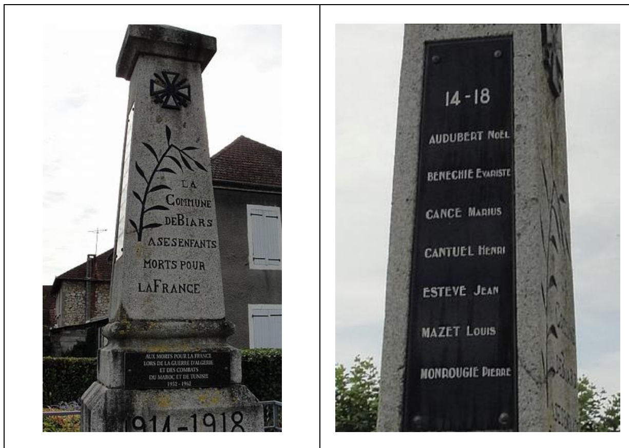
Monument aux morts de la commune de Biars-sur-Cère.