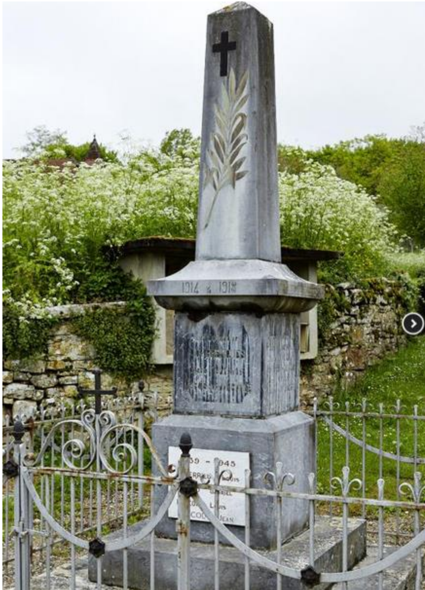
Monumentaux morts de la commune de Brengues