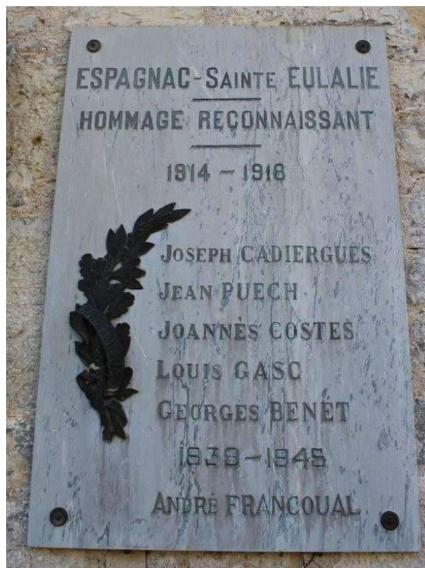
Plaque commémorative apposée à la mairie