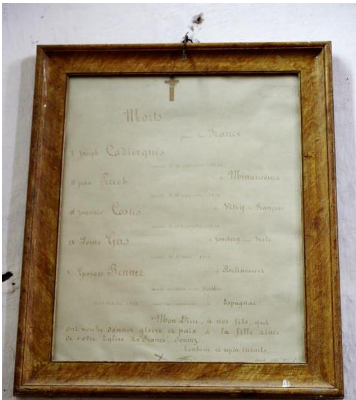
Tableau comportant la liste manuscrite des morts pour la France et apposé à l'intérieur de l'église paroissiale.