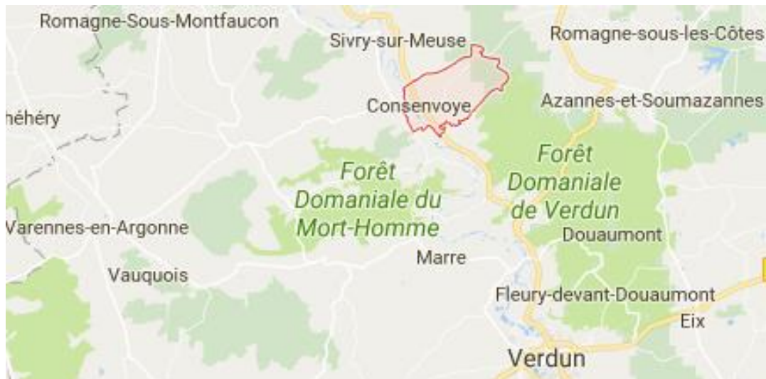
Situation actuelle de la commune de Consenvoye